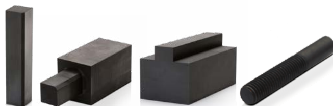
Electrodes carrés, carrés étagés, profils en T et cylindres, prêtes à usiner et compatibles avec la plupart des supports d'électrodes.